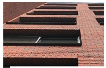
De vervanging van de gevelkozijnen: nadenken over de financiering

In de ALV van dit voorjaar is het besluit genomen om de vervanging van de gevelkozijnen met tien jaar te verschuiven naar 2051. Daardoor valt het buiten het MJOP en wordt er (nog) niet voor gespaard. Dat houdt NU de maandelijkse lasten laag. Maar! Met de vervanging van de 624 gevelkozijnen is - vroeg of laat - veel geld gemoeid. Daar moeten we ons bewust van zijn, om 'straks' een onaangename verrassing te voorkómen. Het Bestuur ziet enkele opties voor de toekomstige financiering. En peilt de meningen op 17 oktober.