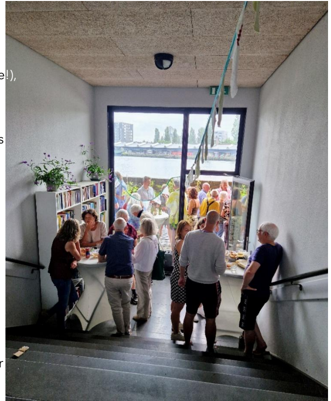
Toen de eerste druppels vielen, werd de burenborrel voortgezet in de enigszins schemerige hal. Het licht was namelijk uitgevallen na een blikseminslag...